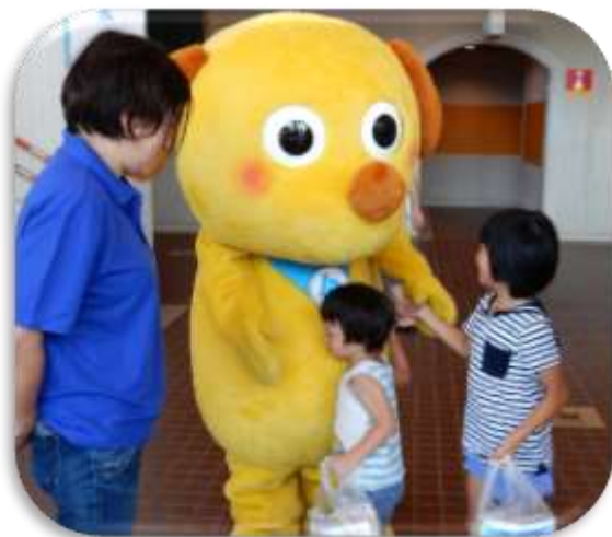
◆けん太くんのお出迎え

また、映画は親子の絆や愛情を描いた「あなたをずっとあいしてる」を上映し、たくさんの親子の方に楽しんで頂きました。