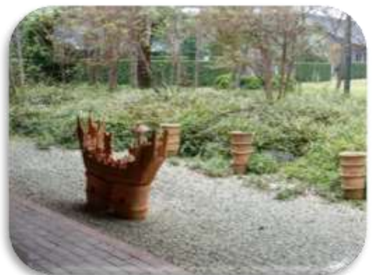
文化財センターのはにわ